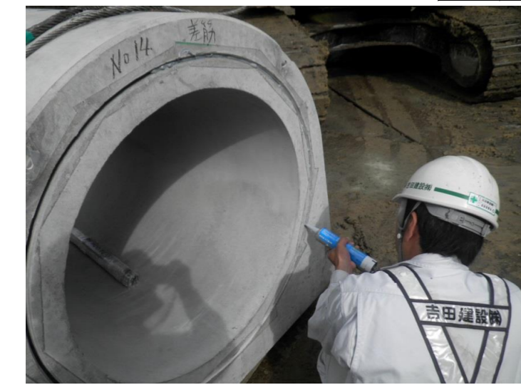
樹脂を充填してます!